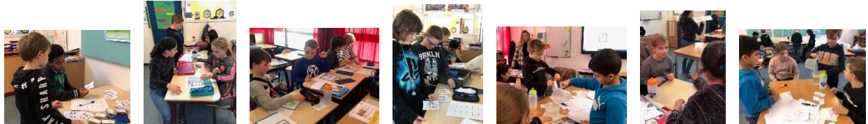
Groep 7 - 8

Ook in de startweek weer een rekencircuit gedaan, fijn dat het weer kon met elkaar. Oefenen met tafels en deelsommen, maar ook met geld en met liters en zelf ervaren hoeveel je in de kan moet schenken voor 9 dl of 90 cl. Ontdekken dat dat hetzelfde is... Spelend leren, heel mooi!