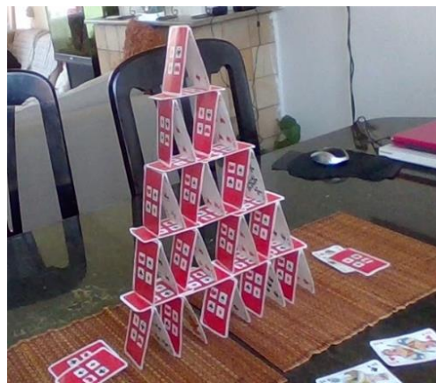
Bouwwerk van Masa.