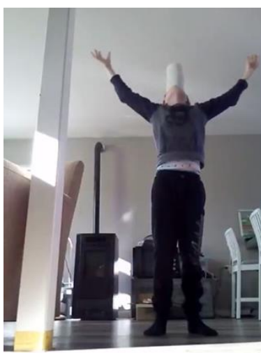
De poging van Maikel.